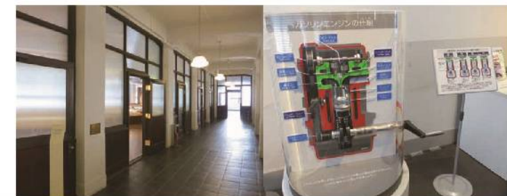
Nissan Engine Museum

You can see the engines and motors built up with the latest and greatest skills and technologies.