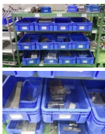
2Sと見える化を実施