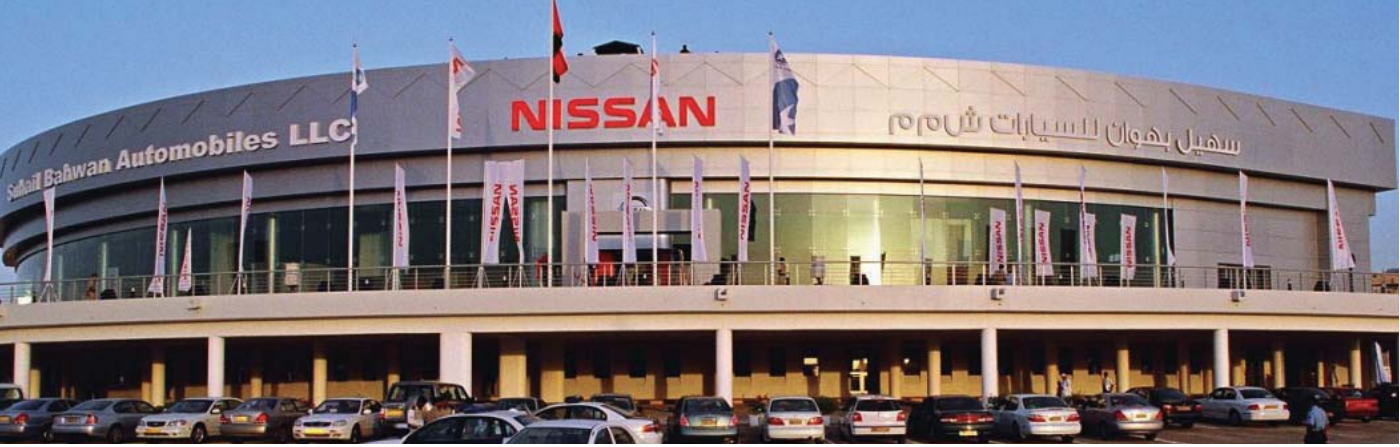
オマーンの世界最大級のショールーム

たとえば2005年度に外部調査機関のお客さま満足度調査で1位になった中国では、2年前から「5つの安心」と名づけたサービス指針を掲げて、他国に先駆けて改善に取り組んできました。