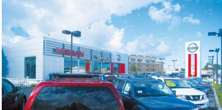
NREDIプログラムを活用して大改装された「ガーディナニッサン」(米国)