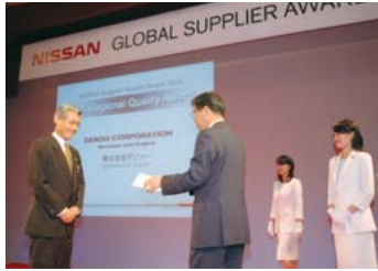
「グローバルサプライヤーアワード」の表彰式