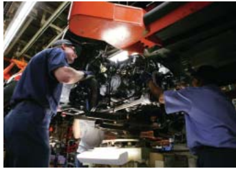
北米日産会社 スマート工場