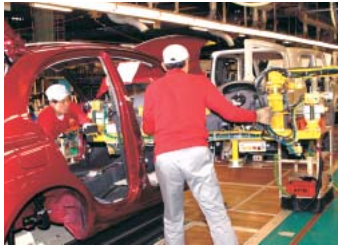
世界中の工場に導入を拡大しているモジュール生産方式(追浜工場)