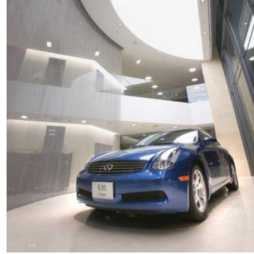
インフィニティの新グローバル・ディーラー・デザイン基準に準拠した韓国ソウル市のショールーム