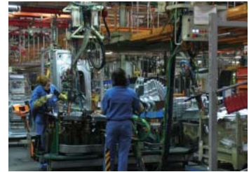
日産モーター・イベリカ会社(スペイン)