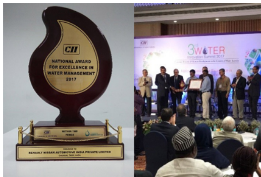
インド工業連盟から表彰されたチェンナイ工場

水使用量削減に向けて、インドのチェンナイ工場やメキシコのアグアスカリエンテス第2工場では雨水利用を目的にため池を整備し、インドのチェンナイ工場、中国の花都工場、日本の追浜工場などでは廃水のリサイクル設備を導入しています。中でもチェンナイ工場の取り組みはインド工業連盟(CII: Confederation of Indian Industry)から優れた水資源管理事例として表彰されました。また北米日産会社(NNA)でも、塗装前処理工程の廃水をフィルターにより